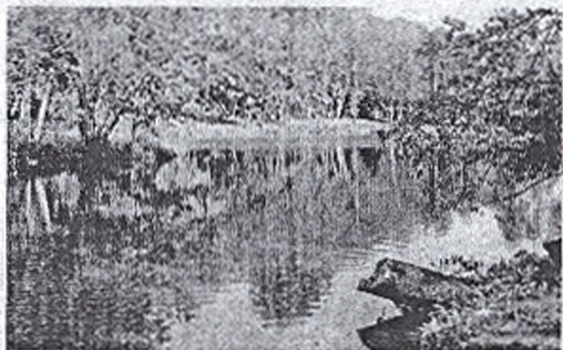
L'étang du moulin a été racheté en début de mandat par la municipalité.